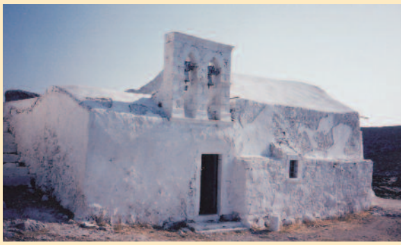
Ο ναός του Αγίου Γεωργίου, όπως είναι σήμερα. Κάτω, ο ναός της Παναγίας και του Αγίου Νικολάου.