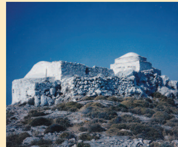
Πάνω, οι δύο ναοί, όπως φαίνονται από την πλευρά της Πελοποννήσου. Κάτω, οι δύο ναοί από την πλευρά του Αβλέμονα.

Η ονομασία San Nicolo είναι πολύ παλαιότερη και οδηγεί στον Άγιο Νικόλαο που βρισκόταν πάνω στο Βουνό, εκεί που ήταν και το Μινωικό Ιερό Κορυφής και δίπλα στον μεταγενέστερο ναό του Αγίου Γεωργίου. Με όλα αυτά διαπιστώνεται η κατοίκηση στον ευρύ-