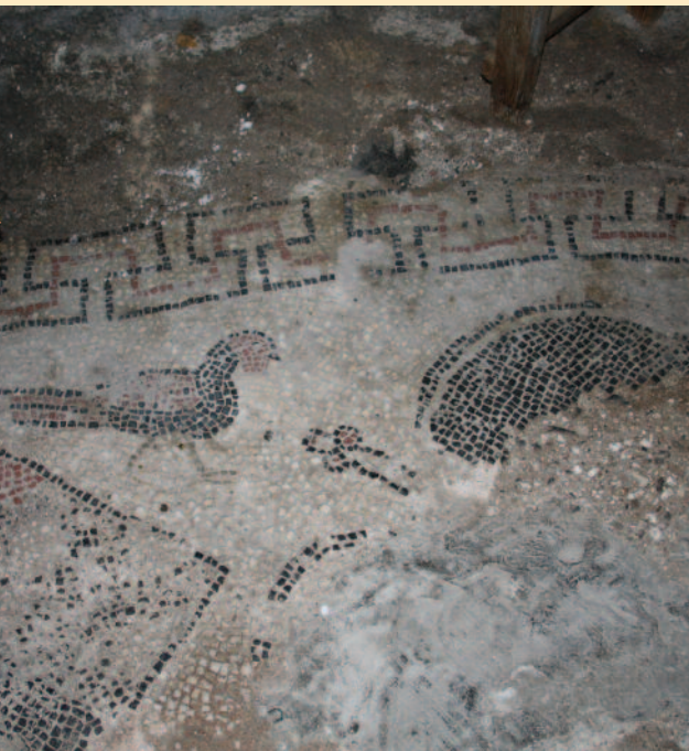
Πάνω η σκηνή του κυνηγιού στο ψηφιδωτό του δαπέδου στον Άγιο Γεώργιο και κάτω λεπτομέρεια από το ψηφιδωτό.