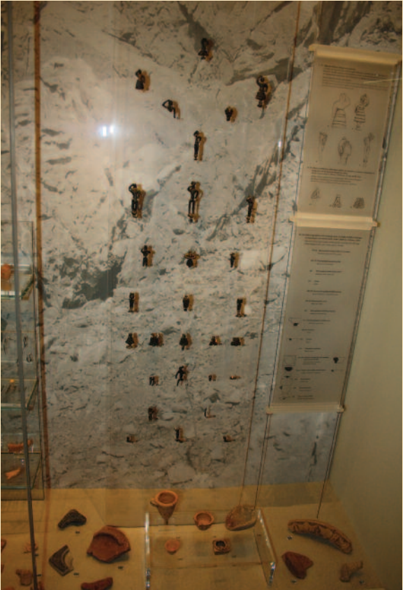
Ευρήματα από το Μινωικό Ιερό Κορυφής στο Μουσείο Κυθήρων.

τερο χώρο 2000 χρόνια π.Χ., αλλά και η συνέχεια στα πρωτοχριστιανικά και στα πρώιμα Βυζαντινά χρόνια. Ασφαλώς δε η έρευνα που συνεχίζεται θα δώσει και άλλα ενδιαφέροντα στοιχεία επιβεβαιώνοντας, συμπληρώνοντας ή και αναιρώντας ίσως, κάποια από όσα γνωρίζουμε σήμερα για τον ενδιαφέροντα αυτόν χώρο.