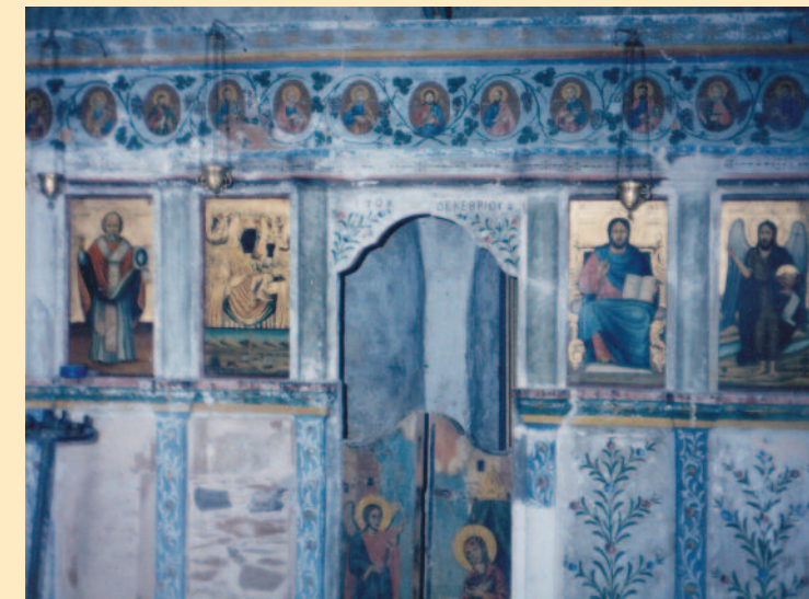
Το τέμπλο του ναού της Παναγίας Μυρτιδιώτισσας με τον Άγιο Νικόλαο αριστερά.