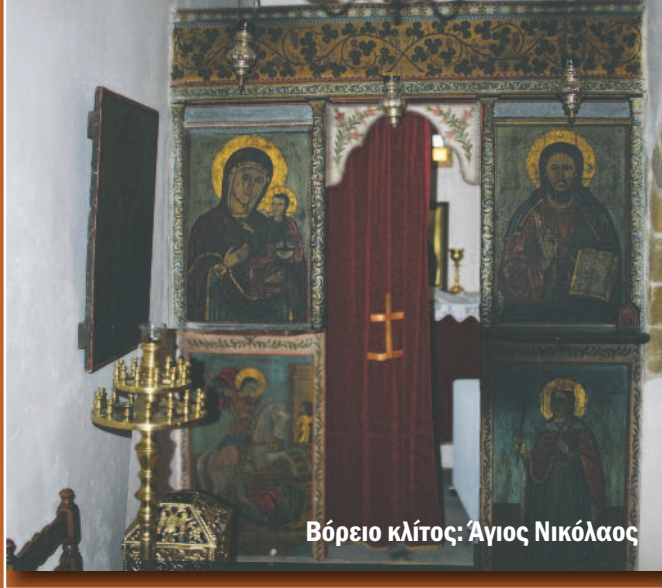
Βόρειο κλίτος: Άγιος Νικόλαος