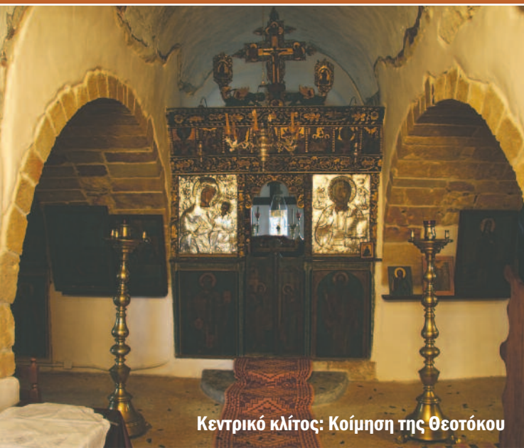
Κεντρικό κλίτος: Κοίμηση της Θεοτόκου